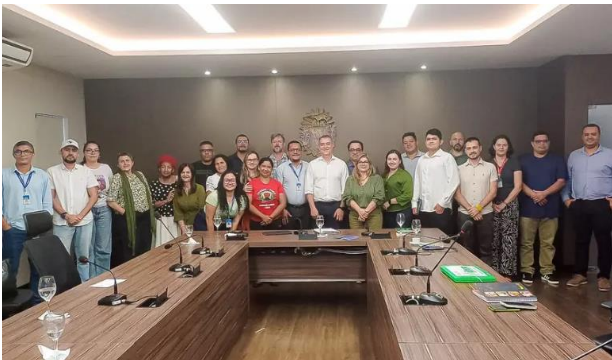
Foto 05: Reunião do Conselho Estadual de Desenvolvimento Rural Sustentável com presidência da CONAB, janeiro de 2025.