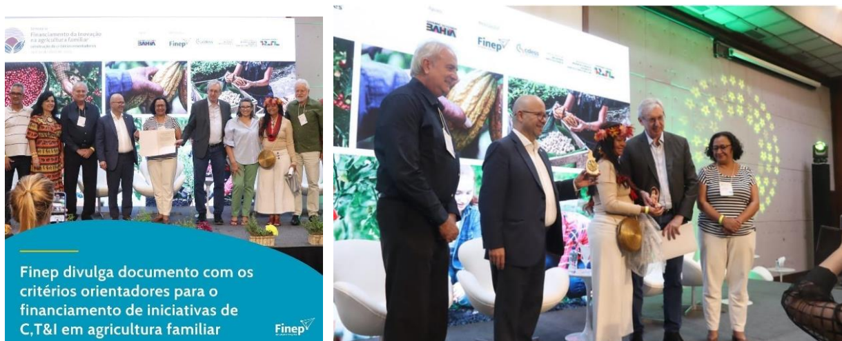
Foto 25: Seminário sobre Financiamento da Inovação na Agricultura Familiar, Salvador-BA, maio de 2025.