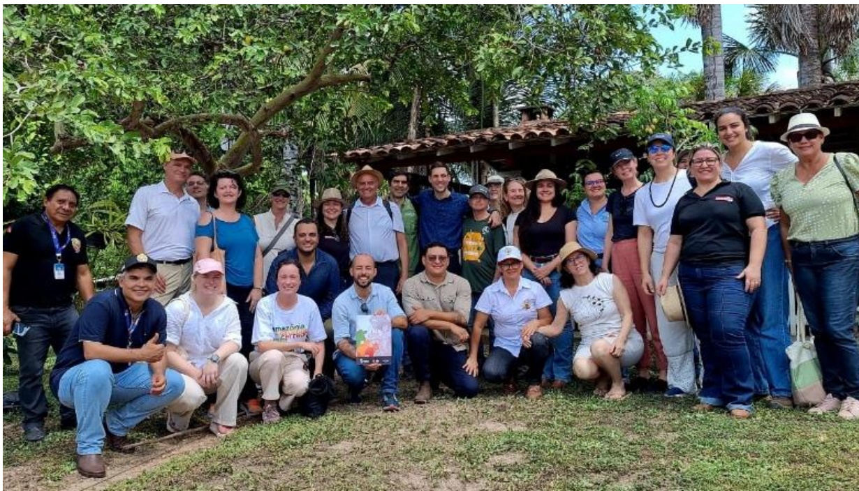
Foto 13: Visita do embaixador da Noruega em estabelecimento rural que aderiu ao Programa Pecuário Sustentável em Inhangapi, novembro de 2025.