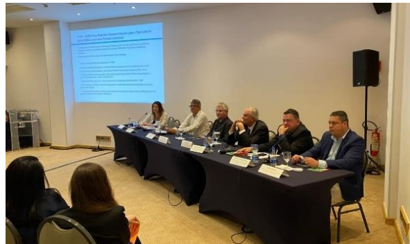
Fotos 23 e 24: Mesa Redonda organizada pelo Banco Mundial: Recomendações para transição do apoio público nos níveis federal e estadual, Brasília-DF, abril de 2025.