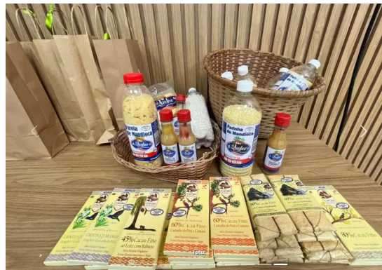
Foto 15 e 16: Seminário Agroindustrialização na produção familiar. Belém, julho de 2025.