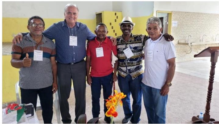
Fotos 19 e 20: Plenária de Construção do Plano de Desenvolvimento Sustentável de Baião, janeiro de 2025.