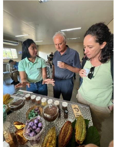
Foto 07: Reunião de trabalho em Brasília com Banco Mundial para tratar da implementação do Projeto Pará da Alimentação Saudável, setembro de 2025 e Foto 08: Visita a indústria Gencau em Medicilândia com equipe do Banco Mundial, setembro de 2025.