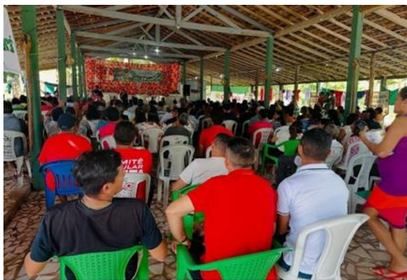
Foto 22: Congresso Estadual dos Trabalhadores Rurais Agricultores e Agricultoras Familiares da GETAGRI, Barcarena, março de 2025.