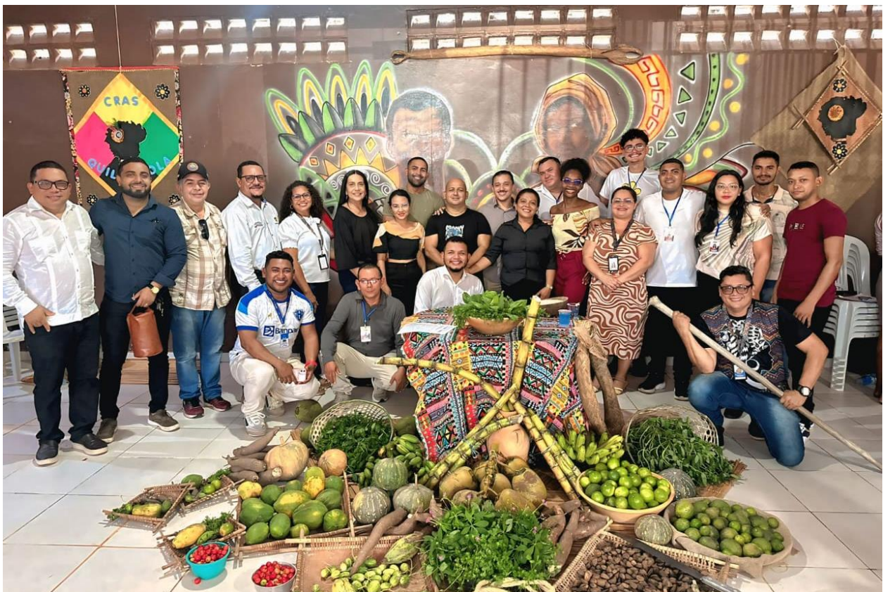
Foto 18: Lançamento do Programa de Aquisição de Alimento em Abaetetuba, abril de 2025