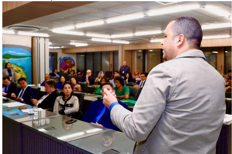
Foto 08: Livro sobre Panorama da Realidade da ATER no Pará, lançado pela SEAF na COP 30, novembro de 2025 e Foto 09: Defesa da PEAPOS em Comissão na ALEPA, maio de 2025