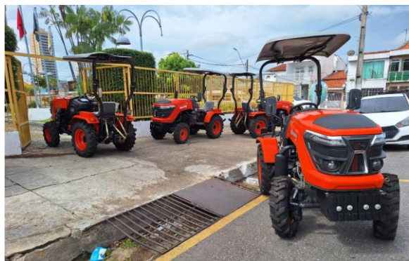
Fotos 03 e 04: Máquinas para micromecanização do Programa Mecaniza Pará, dezembro de 2025.