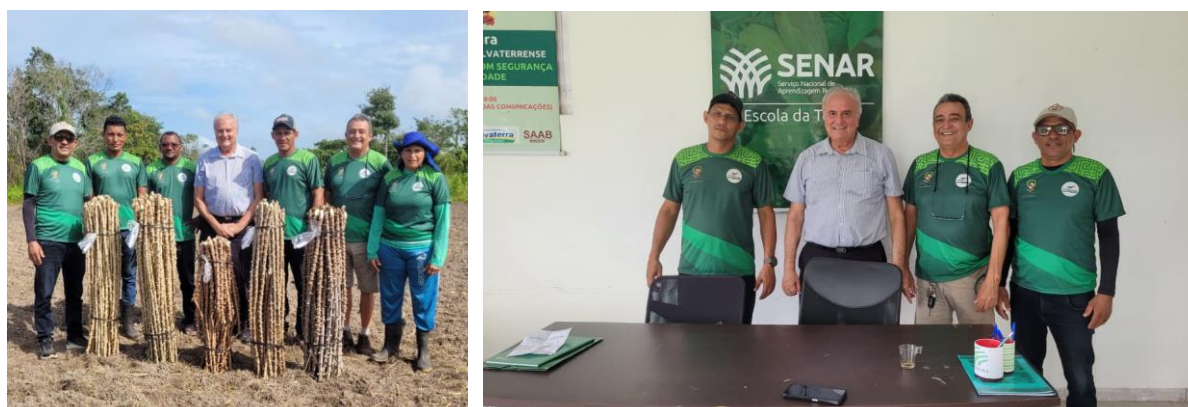
Foto 26: Implantação da área de cultivares de alta produtividade de mandioca na unidade demonstrativa de Salvaterra – SEAF/PM (Salvaterra, junho de 2025).