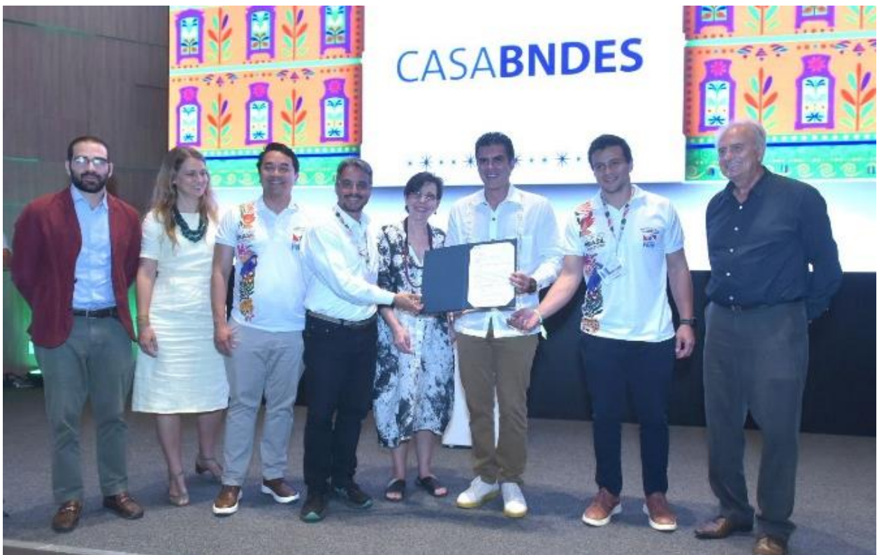
Foto 02: Assinatura de cooperação Governo do Pará – BNDES para a implementação do Projeto Pará+ Sustentável, novembro de 2025.