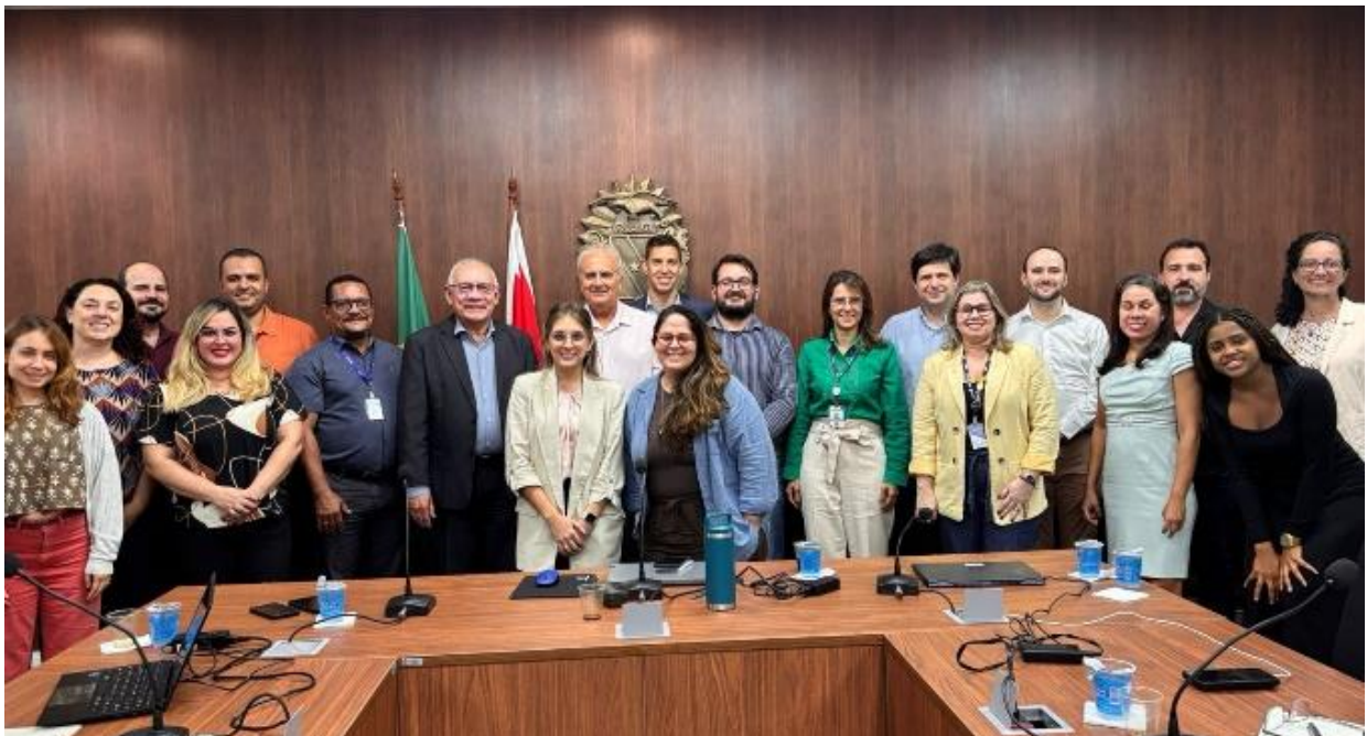
Foto 06: Reunião com SEPLAD e equipe do Banco Mundial para tratar da implementação do Projeto Pará da Alimentação Saudável e da Floresta Viva, setembro de 2025.