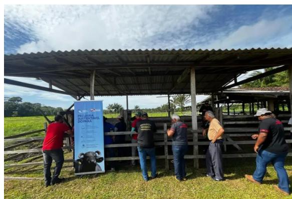
Foto 14: Apresentação do Programa Pecuária Sustentável em Paragominas e Foto 14 - Curso de rastreabilidade em Salvaterra.