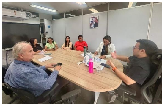
Foto 21: Planejamento da Agenda de Regularização Ambiental da Associação Aprocamp e Cooperativa Coopcamp (SEMAS e SEAF Santo Antônio do Tauá, fevereiro de 2025.