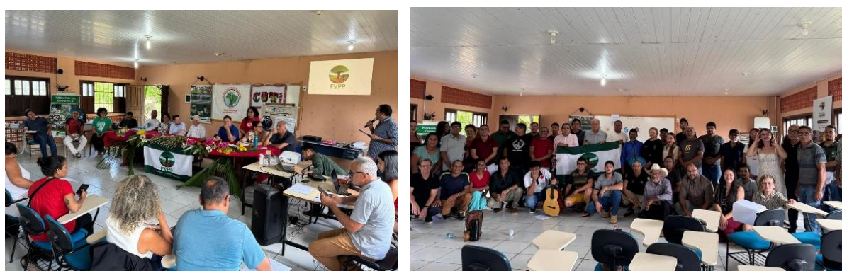
Foto 27: Evento de Planejamento do Desenvolvimento da Agricultura Familiar na Região da Transamazônica e Xingu, Altamira, agosto de 2025.