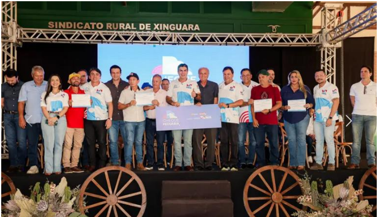
Foto 01: Lançamento do Programa Cheque Pecuária em Xinguara, dezembro de 2025.