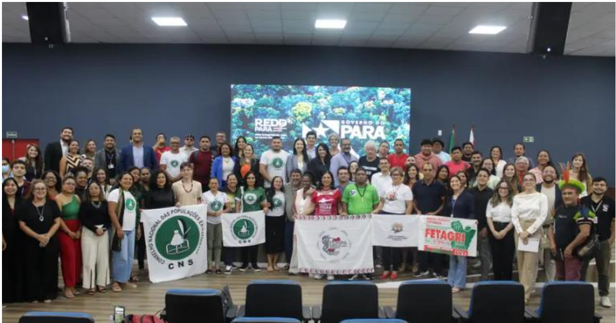
Foto 17: Lançamento do Plano de Consultas Públicas Livres e Consentidas para indígenas, quilombolas, extrativistas e agricultores familiares no âmbito do Programa REDD+, maio de 2025.