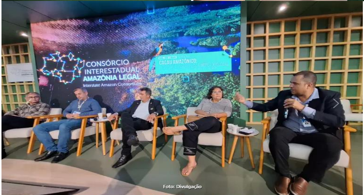
Fotos 9, 10, 11 e 12: Participação da SEAF na COP 30, novembro de 2025.